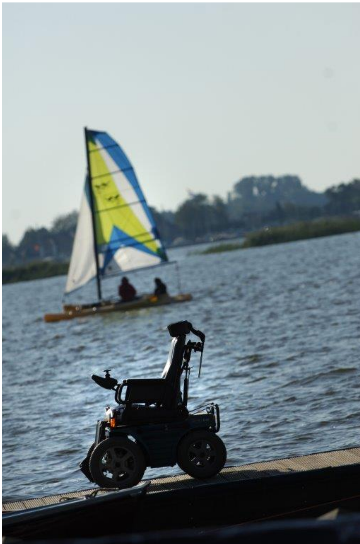
Stichting 't Packhuys Zorgbeheer, beleidsplan 2021-2024, definitief concept d.d. november 2020