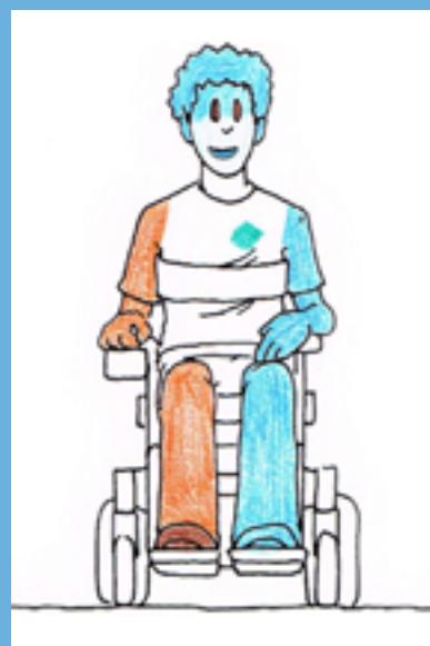
Deelnemers gaven met kleuren aan over welk deel van het lichaam ze meer tevreden (blauw) of minder tevreden (rood) waren.

De onderzoeksgroep van Peters was klein (drie personen). Haar onderzoek moet dan ook gezien worden als een interessant vooronderzoek met een voornamelijk exploratief karakter. Toch is dit onderzoek van betekenis omdat duidelijk is geworden dat de door Peters gebruikte methodologie toepasbaar is voor deze specifieke groep mensen met een NAH. Vervolgonderzoek zal worden uitgevoerd om de bevindingen van Peters te bevestigen. ■