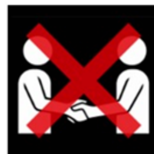
Geen handen schudden