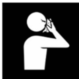
Gebruik papieren zakdoekjes