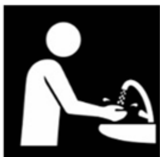
Was je handen regelmatig met water en zeep